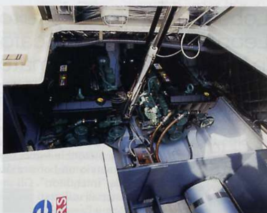
Sopra, la sala macchina con i due Volvo Penta D6-310 Evc Duoprop.